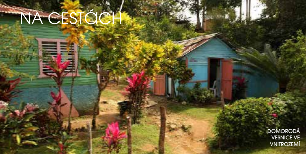
DOMORODÁ VESNICE VE VNITROZEMÍ