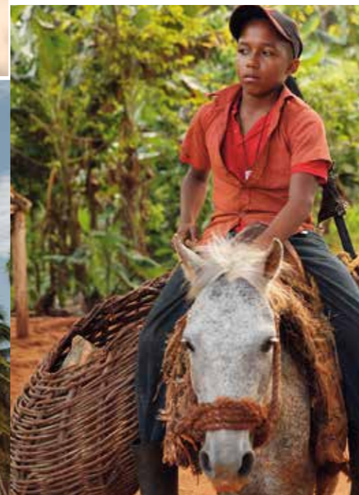
KŮŇ – TRADIČNÍ DOPRAVNÍ PROSTŘEDK DOMORODCŮ. VYUŽÍVAJÍ HO PŘEDEVŠÍM V LESÍCH.