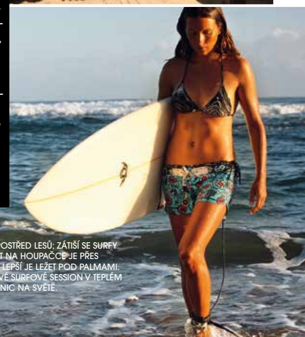
SHORA: VODOPÁD SAMANÁ UPROSTŘED LESŮ; ZÁTIŠÍ SE SURFY U MÍSTNÍ SURFAŘSKÉ ŠKOLY. SEDĚT NA HOUPAČCE JE PŘES POLEDNE ZBYTEČNĚ NAMÁHAVÉ, LEPŠÍ JE LEŽET POD PALMAMI. POCIT Z ÚSPĚŠNÉ DVOUHODINOVÉ SURFOVÉ SESSION V TEPLÉM KARIBIKU BYCH NEVYMĚNILA ZA NIC NA SVĚTĚ.