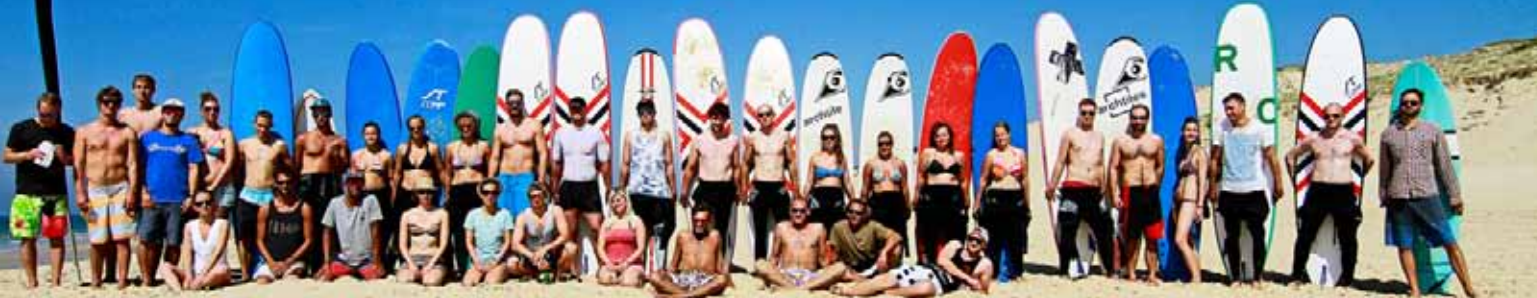
Kto chce ochutnať netradičnú a hlavne nezabudnuteľnú dovolenku, mal by skúsiť práve Surf-trip. Ostanú vám spomienky na výlet, ktorý sme si my vychutnali všetkými zmyslami.